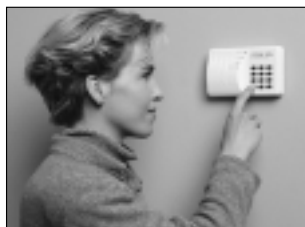
Leicht zu bedienen

Aber heute muß niemand mehr dieser Bedrohung schutzlos ausgeliefert sein - durch moderne Alarmtechnik ist wirksame Absicherung preiswert und einfach in der Installation geworden.