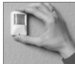
Klein und unauffällig