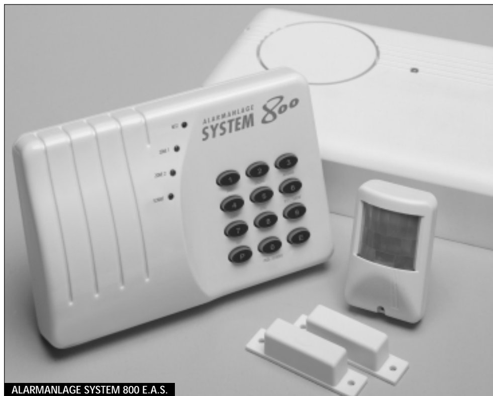
ALARMANLAGE SYSTEM 800 E.A.S.