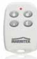
Keyfob remote KR814 Art.nr. 09755