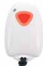
Panic Remote PR811 Art.nr. 09754