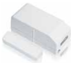
Door Window Sensor DS831 Art.nr. 09759