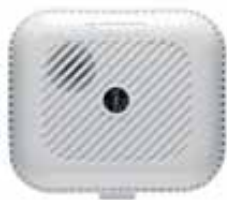
Smoke Detector SD833 Art.nr. 09760