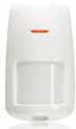
Motion Sensor MS845 Art.nr. 09758