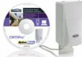
X10 ActiveHomePro incl. CM15Pro Art.nr. EU: 09793 UK: 09800