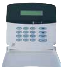
Hardwire LCD Programming Keypad PK836 Art.nr. 09770