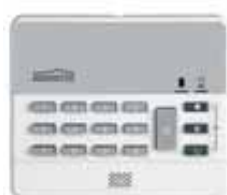
Wireless Keypad WK820 Art.nr. 09756