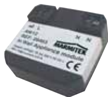
X10 In Wall Appliance module AW12 Art.nr. 09463

For all other Marmitek X-10 modules see: www.marmitek.com