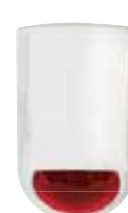
Outdoor Siren-Flash OS826 Art.nr. 09763