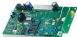
GSM Module GSM800 Art.nr. 09753