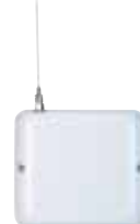
Wireless Repeater RP835 Art.nr. 09764