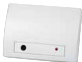
Glassbreak Sensor GB843 Art.nr. 09766